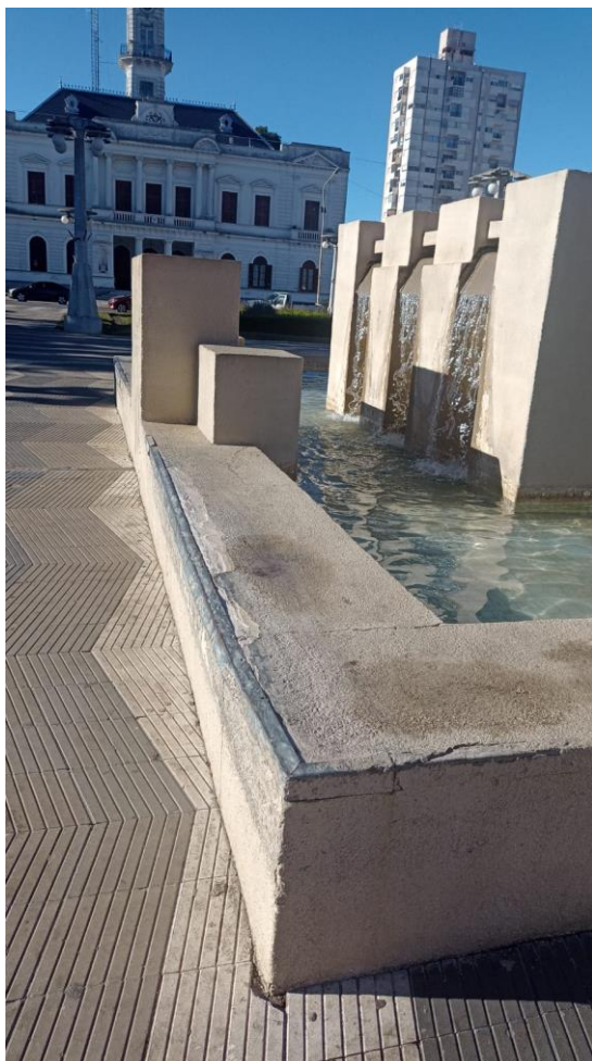
Plaza San Martín