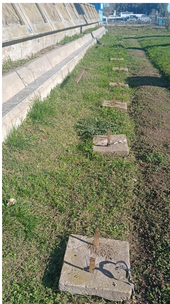
Portada Ingreso a Azul